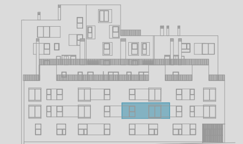
C/ ÁNGEL PUECH