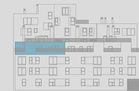
C/ ÁNGEL PUECH