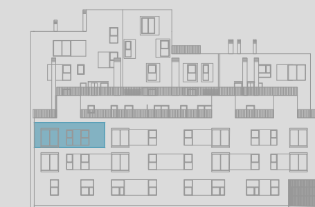
C/ ÁNGEL PUECH