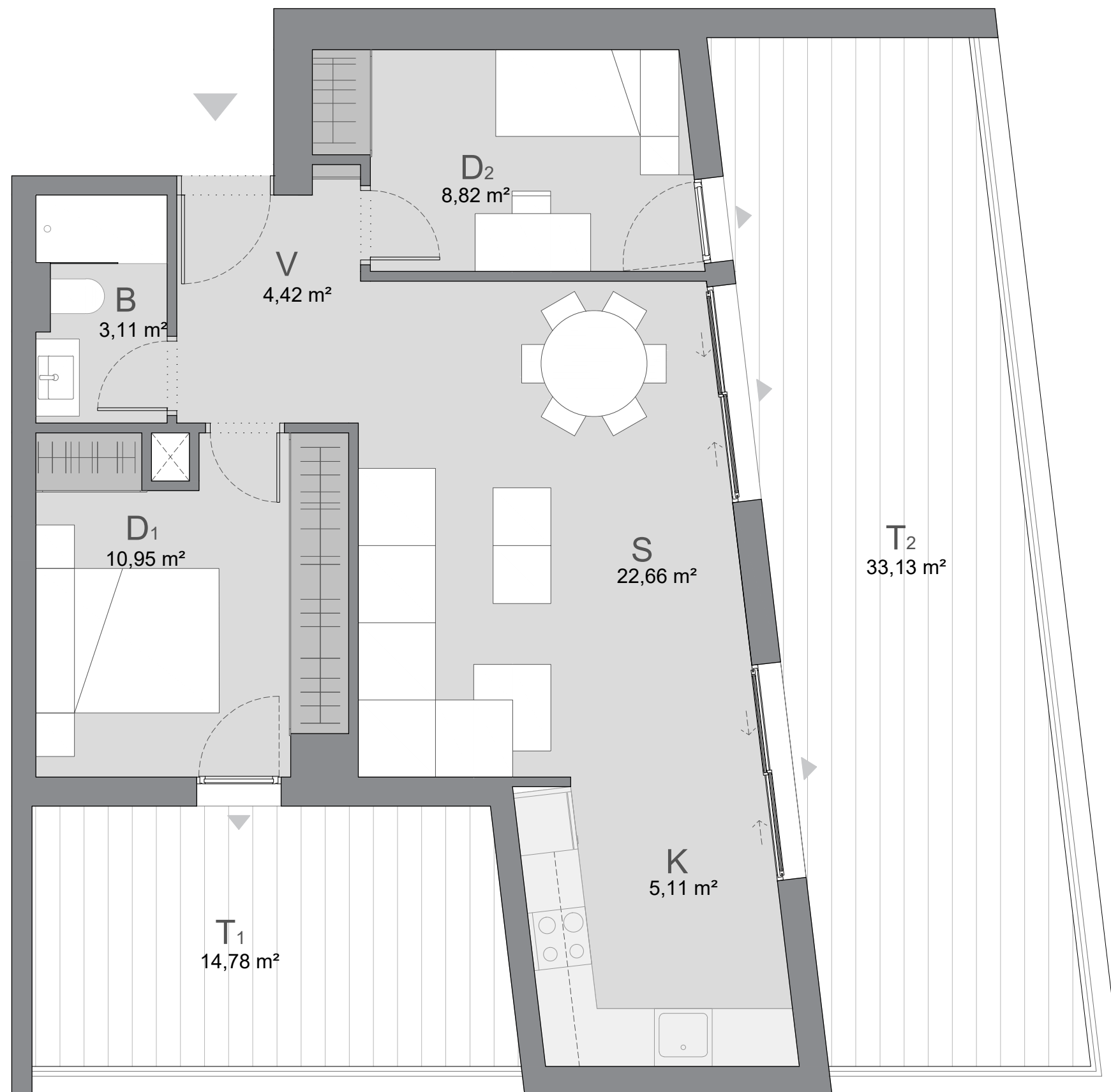
C/ ÁNGEL PUECH