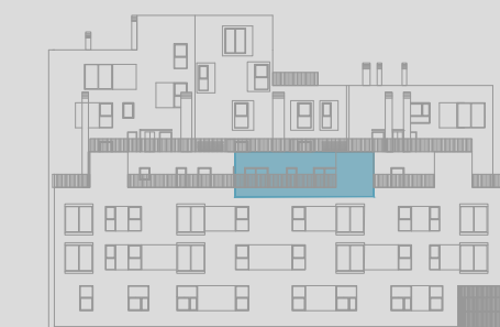
C/ ÁNGEL PUECH