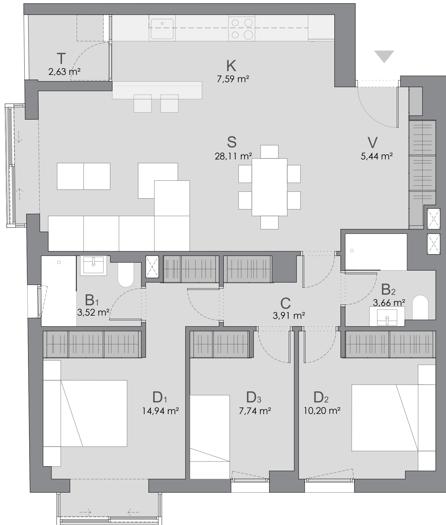
C/ ÁNGEL PUECH