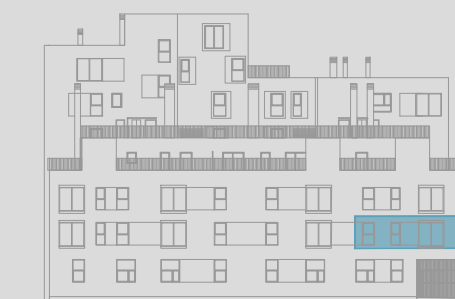
C/ ÁNGEL PUECH